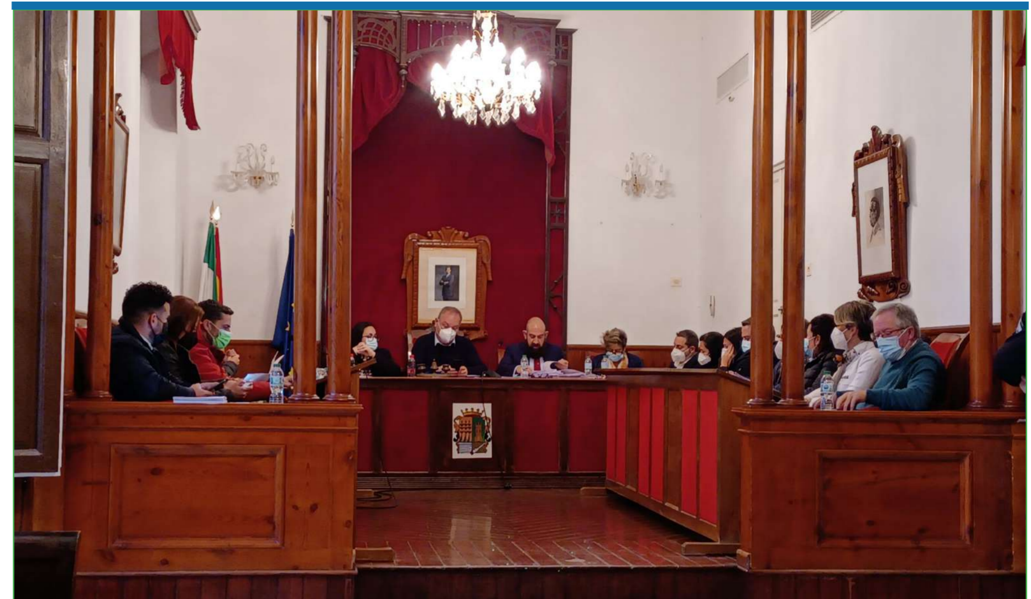
Sesión plenaria en el Consistorio cuevano, en la que se aprobaron las cuentas para el año 2022. Al fondo, el alcalde y el secretario municipal.